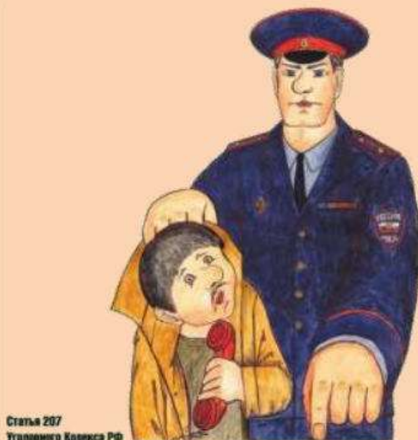
Статья 207 Уголовного Кодекса РФ

ТЕЛЕФОННЫЙ ТЕРРОРИЗМ — ЭТО НЕ БЕЗОПАСНАЯ ШУТКА, А ОБЩЕСТВЕННО ОПАСНОЕ ДЕЯНИЕ.